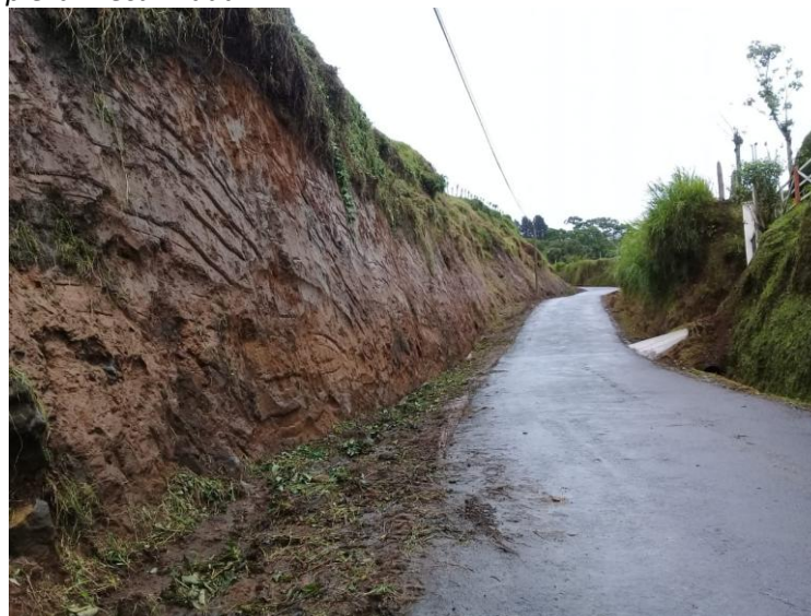
Fotografía 1- Limpieza Mecanizada