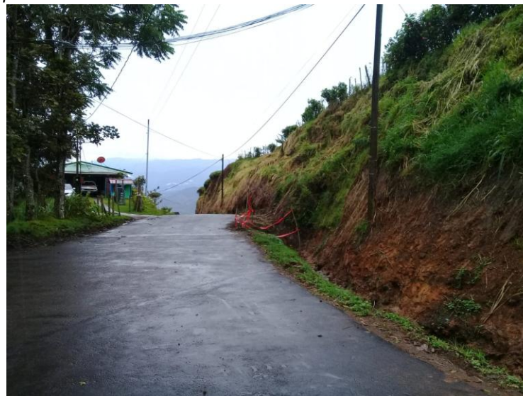
Fotografía 3- Limpieza Mecanizada