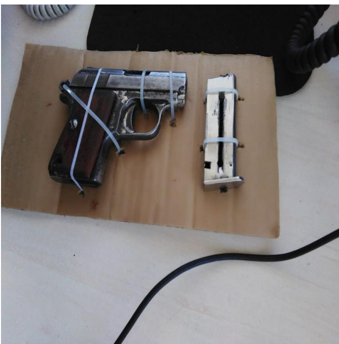
Armas decomisadas, en asalto al Bar la Fortuna